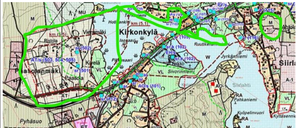
Ote yleiskaavasta likimääräisine aluerajauksineen

Suunnittelualueelle on laadittu vuonna 2008 kuntakeskuksen ja Pyhäveden alueen osayleiskaava, jossa Paasolanmäen alue on pääsääntöisesti osoitettu merkinnällä AT, AT/s, VL, km sekä W. Kirkonkylän alueella Tervaniemen alue on osoitettu merkinnöillä AP/s, AL sekä W. Lisäksi AP/s aluevarauksen alueella on osoitettu rakennuksen merkinnöillä sr (109) ja sr (110). Molemmilla alueilla on kulttuurihistoriallisia arvoja. Siirilahden alueella on kumottavalla alueella vesialuetta W sekä sisämaassa maa- ja metsätalousaluetta merkinnällä M sekä asuinalueita merkinnällä A-1.